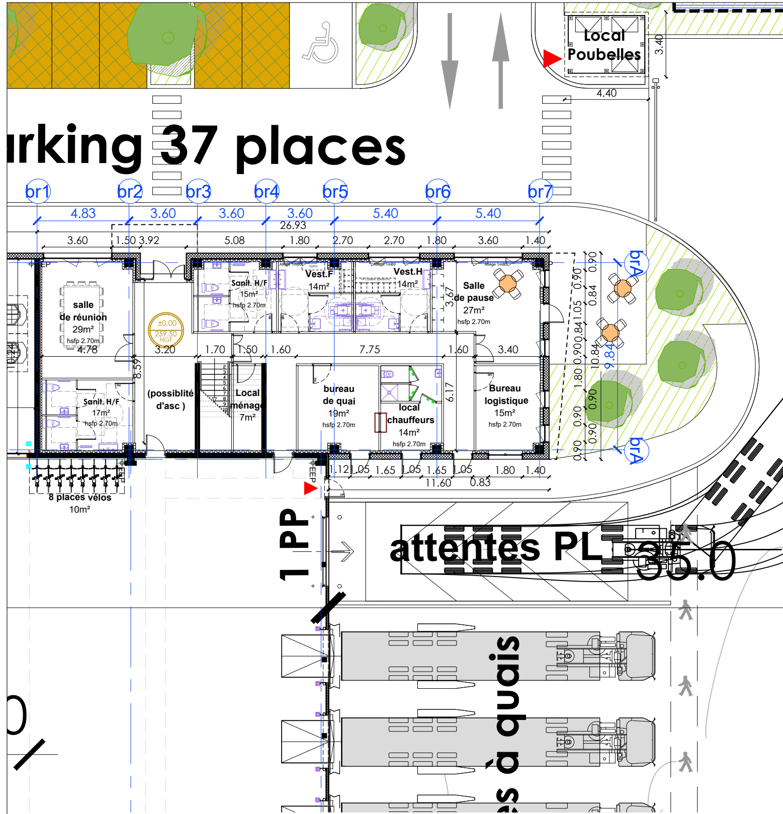
PLAN RDC BUREAUX 1/200ème