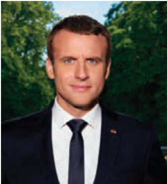
Emmanuel Macron Président de la République